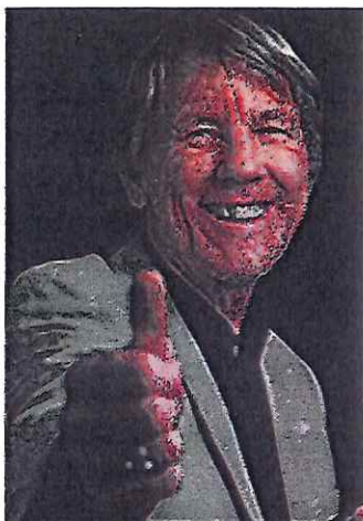
Illustration: Maksim Kabakou